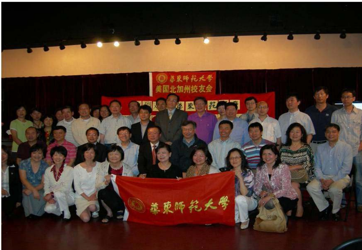
(华东师大美国校友会北加州分会欢迎华东师大任友群副校长一行)